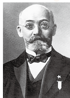
L. L. Zamenhof(1859-1917)

エスペラントは1887年にポーランドのユダヤ人眼科医ザメンホフ博士によって作られた人工国際語です。当時のポーランドは帝政ロシアの支配下で、ロシア人、ドイツ人、ポーランド人、ユダヤ人が対立していました。民族間の憎しみや誤解の原因は共通に理解できる言語がないことだと考えたザメンホフは、どの民族にとっても中立で、習得も容易で、民族間の橋渡しになる言語を作ろうと考えたのです。人工語なので文法には不規則変化や例外がなく、発音も簡単で、とても学びやすい言語です。