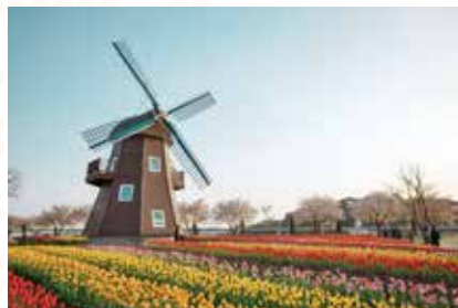
オランダの風車とチューリップ畑

オランダ語は、オランダやベルギー北部などで約2000万人の人々によって話されている言語です。英語、ドイツ語と同じゲルマン語派の西ゲルマン語に属しているので、この3つの言語はとてもよく似ています。オランダ語はちょうど英語とドイツ語の中間のような言語と言えるでしょう。例えば英語のWhat is that? はドイツ語ではWas ist das? で、オランダ語ではWat is dat? です。Miffy(オランダ語ではNijntje)の絵本や『アンネの日記』はオランダ語で書かれています。